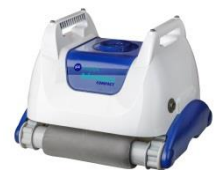
Roboter Robot RKA80