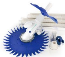
Automatischer Bodenreiniger Automatic cleaner 19007