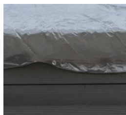
Winterabdeckung Winter cover CIKPCOR60