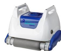
Roboter Robot RKA80