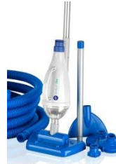
Reinigungsset bodensauger Manual cleaner AR20637