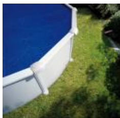
Isothermische Abdeckplane Isothermic cover CVPE350