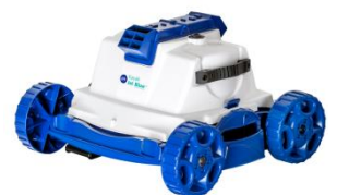
Roboter Robot RKJ14