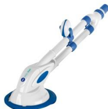
Automatischer Bodensauger Automatic cleaner 90399