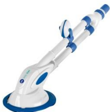
Automatischer Bodensauger Automatic cleaner 90399