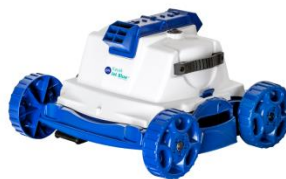
Roboter Robot RKJ14