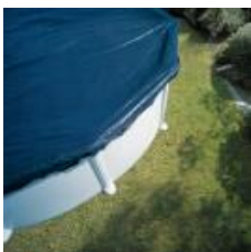
Winterabdeckplane Winter cover CIPR551