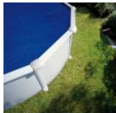
Isothermische Abdeckplane Isothermic cover CPR550